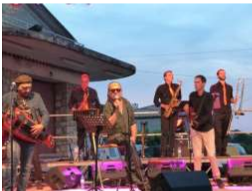
Concert de la Régglyssouille