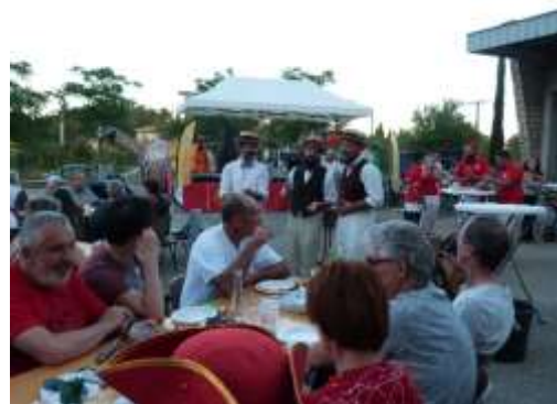
Repas musical avec Aqueless