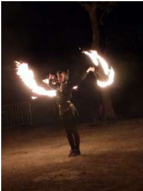
Danseuse de feu

A cette occasion un spectacle de feu et de lumières est réalisé avant l'embrasement. Le bûcher enflammé s'en suivra la farandole et le saut du brasier.