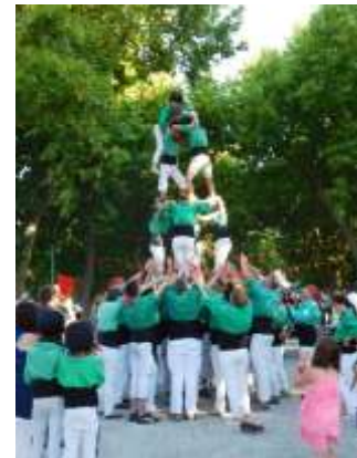
Echange de traditions et de cultures