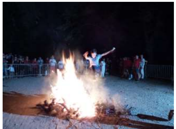
Farandole et saut du feu de la Saint-Jean