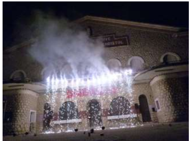
Embrasement de la Cave Coopérative