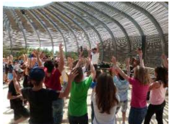
Animations jeune public