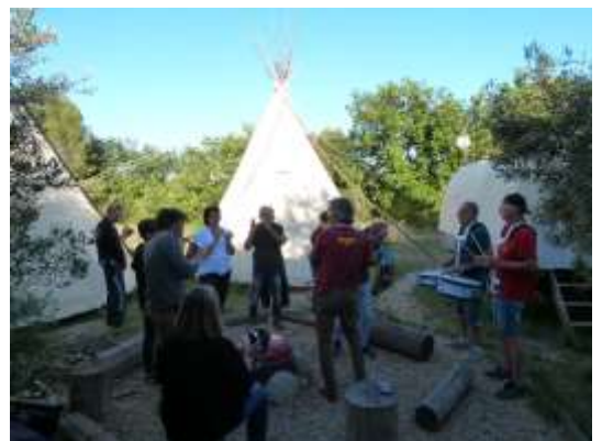
Répétition en extérieur