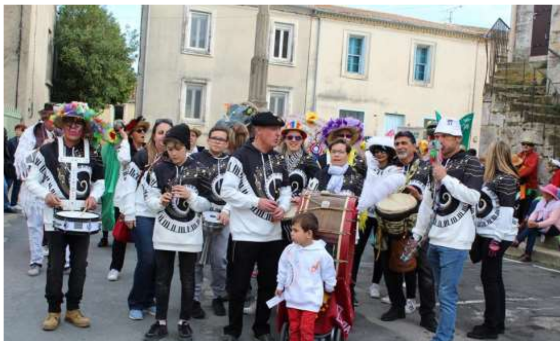
Fanfare des Baragonaires