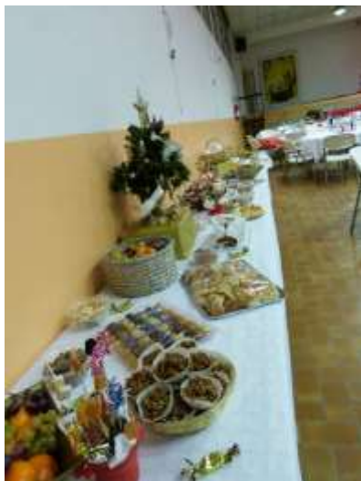
Buffet des 13 desserts

La soirée est chaque année conviviale et chaleureuse !