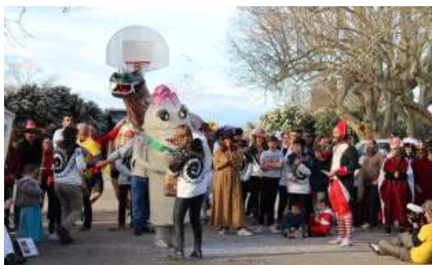
Intronisation de l'Asperge

A l'issue de la cérémonie un grand repas musical a clôturé cette journée carnavalesque.